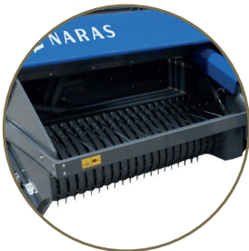
Yüksek kaliteli toplama tırnağı