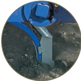
Balta ve çapa tipi ayaklar