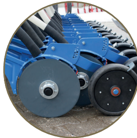
Disk tipi ayaklar