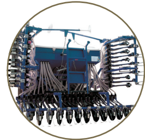
Katlanabilir hidrolik şasi ile güvenli taşıma